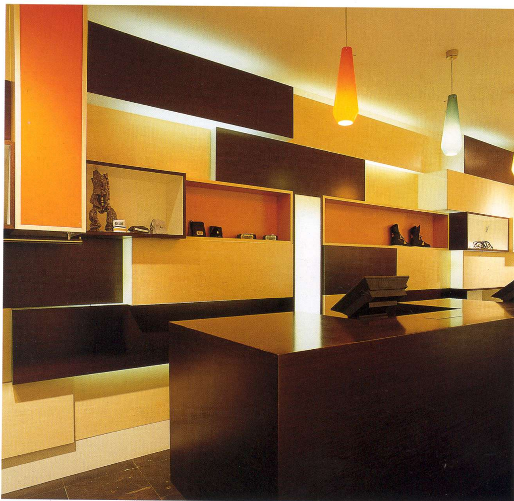
2 大面积的均匀照明是商业空间建筑设计的一个组成部分。立方形体、色彩、纵深的共同作用产生了一个活泼的、令人兴奋的氛围。如果没有柜台上方不太适宜的吊灯的话，效果会更好。

二楼的怀旧60年代专卖区是一个富有魅力的世界，由奇异的场景组成，散发出一一种虚幻的真实感。这是一个由曲线墙面，带雕饰的柜台，色彩明快、柔软舒适的表面组成的有机空间，所有这些产生一种超越生活的真实。建筑师试图建造一个梦幻世界，灵感来自于70年代风格的作品和充满魅力的娱乐